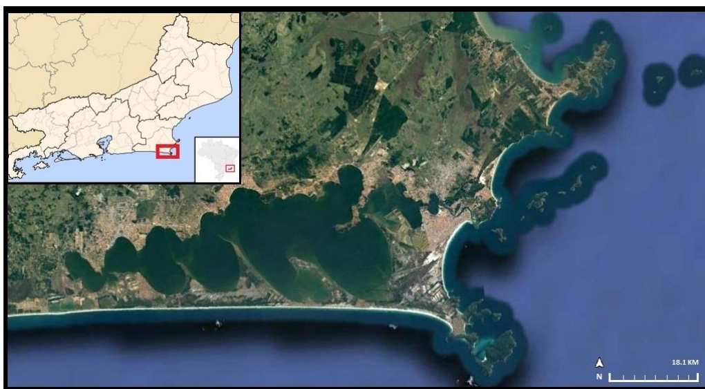
Figura 1 – Localização da área de estudo.

O sistema lagunar de Araruama, localizado na região da baixada litorânea do Estado do Rio de Janeiro/Brasil (Figura 1), é reconhecido pela sua abundante produção de sal. Trata-se de um corpo hídrico lagunar hipersalino, confinado após a formação da Massambaba, uma restinga dupla formada entre as épocas do Pleistoceno e do Holoceno (120 mil a 7 mil B.P.) decorrente de uma complexidade de fatores geológicos e de variações do nível médio do mar (NETO, 1984, pp. 61-63. MUEHE, 2011, p. 317. KJERFVE et al. , 1996, p. 704. DIAS; KJERFVE, 2009, pp. 244-248).