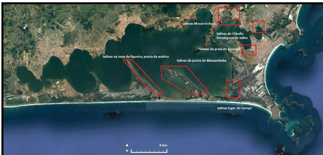
Figura 5 – Localização aproximada das salinas junto a São Pedro da Aldeia, Cabo Frio, Ponta da Massambaba e Ponta da Acahira.

Pedro da Aldeia, somente é revitalizada após o investimento de Leger Palmer (MASSA, 1980, p. 79).