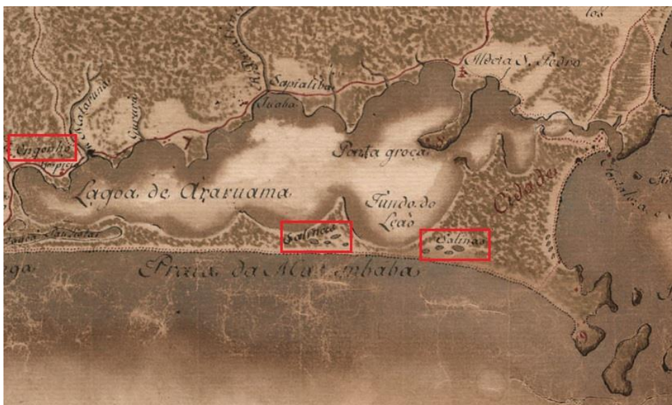
Figura 2 – Localização do Engenho e representação de salinas na restinga de Massambaba (BNB, Cartas topográficas da capitania do Rio de Janeiro... , 1767).

aos engenhos de açúcar da fazenda, se avistava um prado cheio de pântanos e charcos (MAXIMILIAN, 1820, p. 70). Cartografia do século XVIII confirma a existência de um engenho, junto à localidade de Araruama (Figura 2) e um mapa de 1929 representa salinas na mesma área (Figura 3), supondo-se ter sido aí a localização da Companhia Fluminense de Salinas .